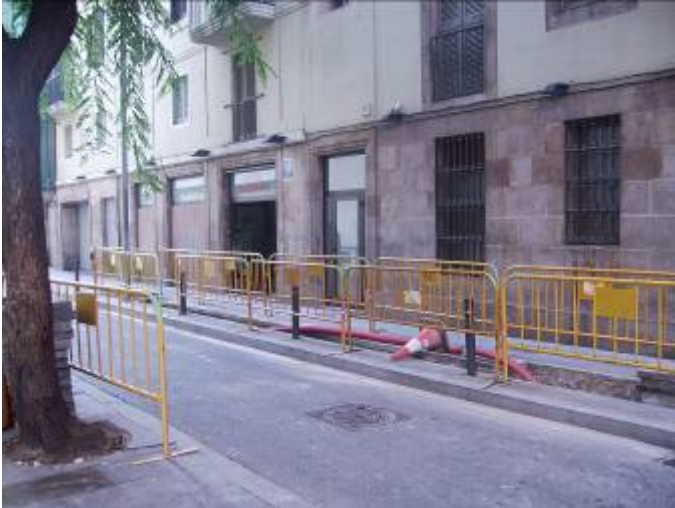
Foto 1. Rasa del carrer Marquès de Barberà