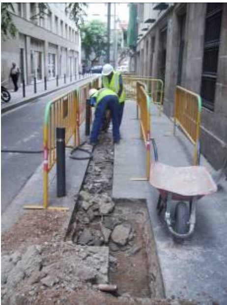
Foto 2. Obrers rebaixant la rasa del carrer Sant Ramon