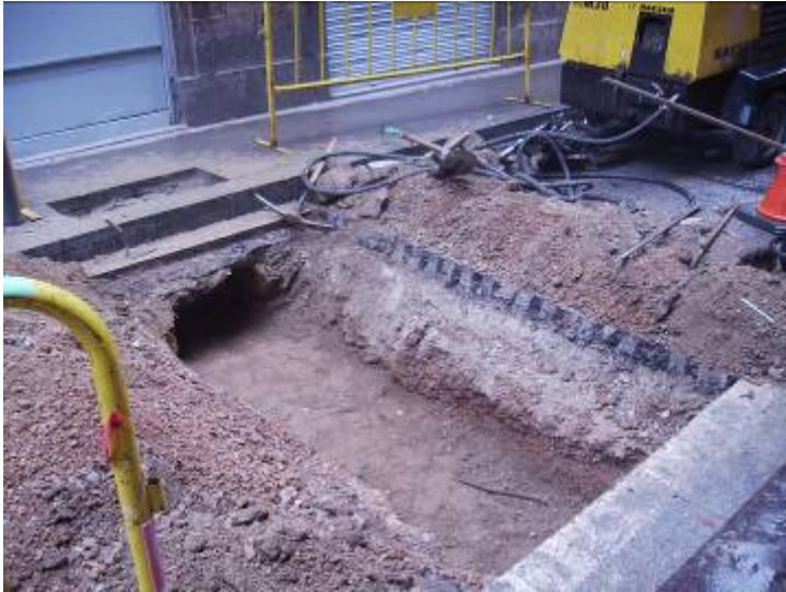
Foto 3. Tram ja rebaixat de l'encreuament entre c/ Sant Ramon i c/ Marquès de Barberà.