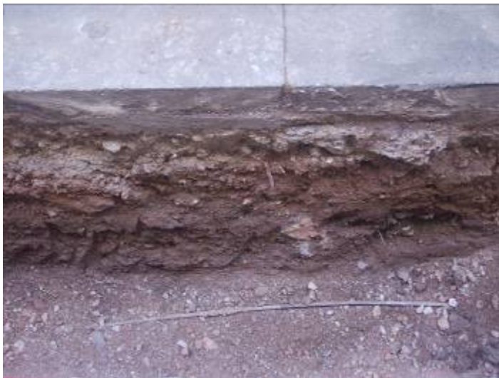
Foto 4. Estratigrafia de la rasa.